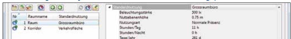
2 Typische Räume erfassen.