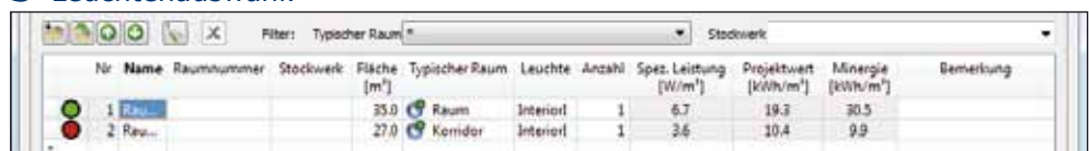
4 Das Raumbuch führt die Angaben aus den Schritten 2 + 3 zusammen.